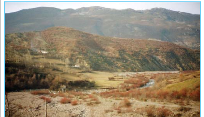
Shelgjishte (Malqene) Ujmisht

Meqë shelgu është një e ardhur e mirë për familjet