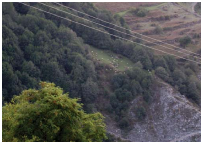
Verrishte (Shkinak) Çaj

25 – 30 m lartësi, ka lëvore të lëmuar në fazat e hershme dhe më vonë bëhet me të thelluara. Trungun e ka të drejtë, me degë të vendosura në mënyrë të çrregullt. Degët kanë bisqe të shkurtër (herë-herë mesatarë), me gjethe vezake apo të çrregullta, me nervaturë të rregullt, me ngjyrë të gjelbër të errët, prej nga ka marrë edhe emrin i zi (i errët). Verriri i zi ka lule monoike, në trajtë boçesh në dy lloje lulesash mashkullore dhe femërore. Lulesat