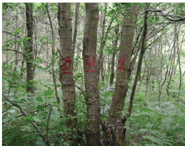
Verrinj në Vilë – Bushtricë

Mund të bëhen edhe prerje me të zgjedhur dhe struktura bëhet shumëmoshore apo më shumë se njëkatëshe. Kjo mënyrë është më e përhapur, sepse fermeri ka nevojë çdo vit për thupra, hunj e dru zjarri, por gjithmonë duke ruajtur numrin e drurëve/ha. Në këtë vështrim mund të këshillohet fermeri se si ta bëjë prerjen, në mënyrë që të trajtohet verriri dhe të ruhen pyjet apo grumbujt e dushqeve e të frashrit për lëndë punimi dhe verriri për dru zjarri.