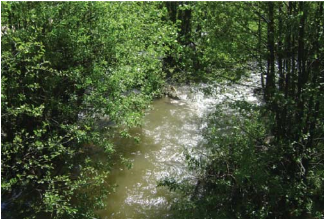
Verriri i zi në Novosej (Shishtavec)

Në tre ujëmbledhësit e rrethit të Kukësit, Veleshicë, Bushtricë e të Lumës, verrishtet e shelgjishtet, duke përfshirë edhe pjesëmarrjen e plepshiteve, janë përhapur e zhvilluar mjaft. Në përgjithësi verriri dhe shelgjet bëjnë pjesë tek drurët e butë dhe energjinë kalorifike e kanë më të vogël se drurët të tjerë, si dushqet, ahu, etj. Shelgjet, në krahasim me verririn e zi ( Alnus glutinosa ) janë edhe më të butë, prandaj gjithmonë janë përdorur për thupra, për punime artistike, me e pa lëvore, si shporta apo thurje të tjera e shumë pak për ngrohje, vetëm aty ku nuk ka drurë të tjerë.