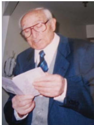
Duke folur në një konferencë