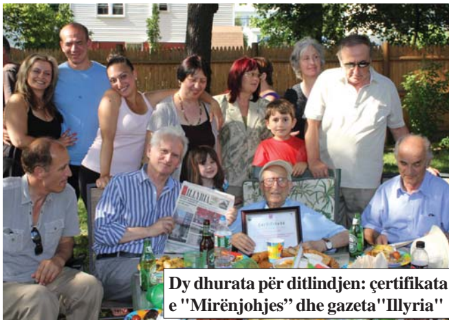
Dy dhurata për ditëlindjen: çertifikata e "Mirënjohjes" dhe gazeta "Illyria"