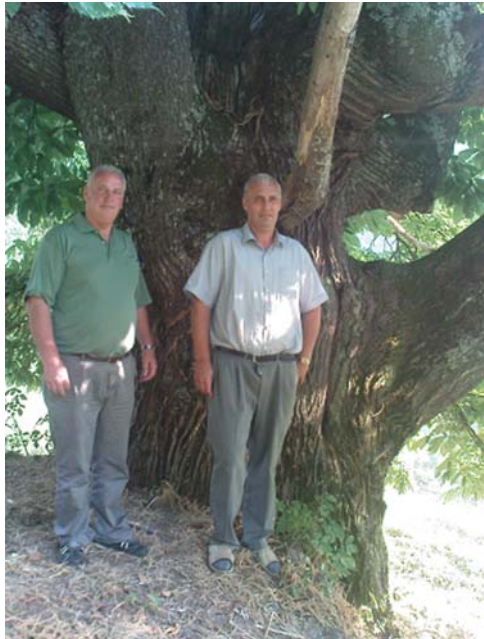
Pranë gështenjës eksponat natyrorë, Dolloc, Suharekë

Janë regjistrat e radhëve, të pronarëve të pyjeve privatë, që zgjaten, takimet e tyre me qëllim ofrimi, njohjeje e bashkimi, për të