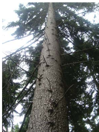
Trung hormoqi rreth 100 vjeçar, Rugovë