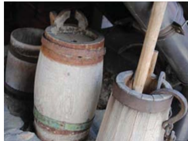
Mjete druri për të përpunuar qumështin

për ndërtimin e kasolleve, debaneve, shtëpive, ndërtesave dhe objekteve të ndërtuara, siç janë xhamitë, kishat, katedralet, mullinjtë, urat, çatia e Kalasë "Rozafa", Shkodër, brendia e mullirit të Haxhi Zekës në Pejë, Hani i Haraçive në Gjakovë, etj.