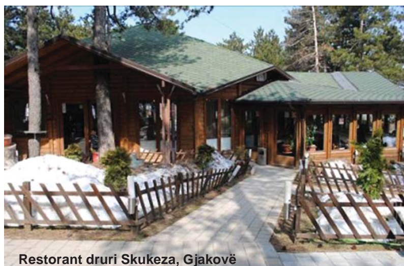
Restorant druri Skukeza, Gjakovë

Trajuam shkurt disa nga cilësitë, vlerat dhe përdorimet, për të cilat mund të shkruhen faqe të tëra. Por, edhe nga këto pak shembuj që sollëm, del qartë se druri është një mrekulli që natyra bujare i ka "dhuruar" njeriut. Atëherë, edhe ne duhet ta kemi obligim që të kujdesemi për pyllin, ku rriten drurët, që na bëjnë gjithë këto shërbime.