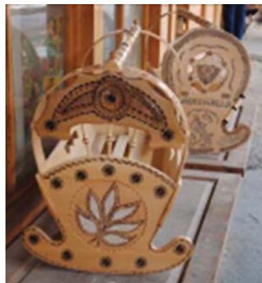
Djepe prej dru ahu

nëpër anët e ndryshme të botës mbi shfrytëzimin e drurit në historinë e njerëzimit, jo vetëm si material i jashtëzakonshëm për plotësimin e nevojave më të llojllojshme, por edhe për nevojën e shprehjes shpirtërore për garë me të bukurën.