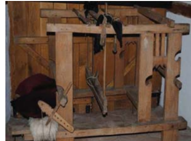
Veku për prodhim qilimash

Çështje me rëndësi është shfrytëzimi i drurit në formën finale të tij. Druri është pra një material shumë i çmuar. Me vlera komparative të drurit kuptojmë vetitë estetike të drurit (ngjyra, tekstura, por edhe "gabime" të drurit), ngrohtësinë e tij në kontakt me njeriun, mundësinë e dhënies se formës dhe përpunimit në përgjithësi. Në këtë kuptim, druri masiv në të ardhmen do të shfrytëzohet para se gjithash aty ku vjen në kontakt direkt e indirekte me njeriun.