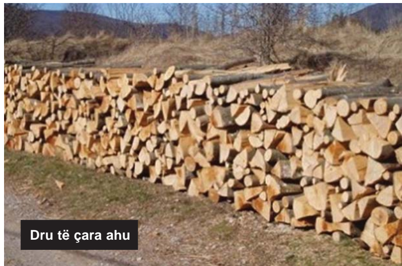
Dru të çara ahu