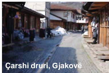
Çarshi druri, Gjakovë

shme, druri në fillim është përdorur i pa ose me një përpunim minimal. Në një shkallë më të lartë të zhvillimit të vet, njeriu, i vetëdijshëm për cilësitë dhe vlerat e drurit, pret e sharron pemën (lisin) dhe shfrytëzon pjesët e saj për të përmirësuar kushtet e veta të jetës. U vuri zjarrin sipërfaqeve të mëdha të pyjeve dhe i transformoi në sipërfaqe të punueshme bujqësore. Pyje ka me bollëk dhe njeriu i preokupuar me veten nuk mendon (për vedit) për të ardhmen e largët dhe mundësinë e shkatërrimit të pyjeve dhe shfarosjen e tyre si dhe humbjen e burimit të atij materiali të dashur e të vlefshëm për njeriun - drurit. Është interesant edhe për ne sot se si njeriu ka ditur ta vlerësojë drurin deri edhe për zbulim, duke i dhënë forma artistike drurit dhe prodhimeve të tij.